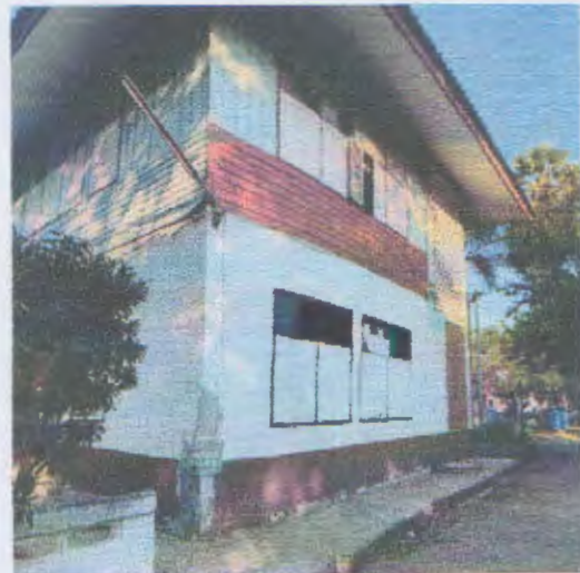
ด้านข้างอาคาร (ฝั่งซ้าย)