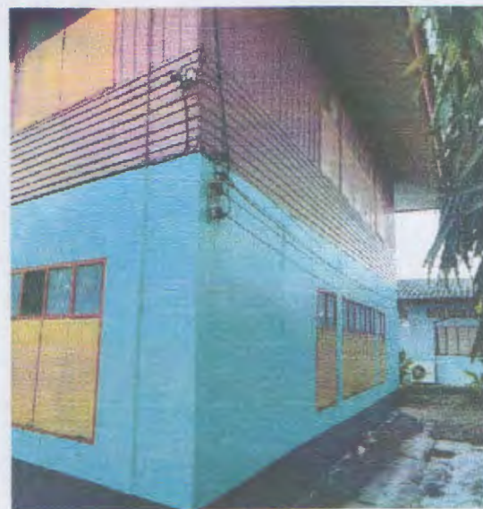
ด้านข้างอาคาร (ฝั่งขวา)

ขอรับรองว่าเป็นภาพด้วยอาคารที่ขอหรือถอนจริง