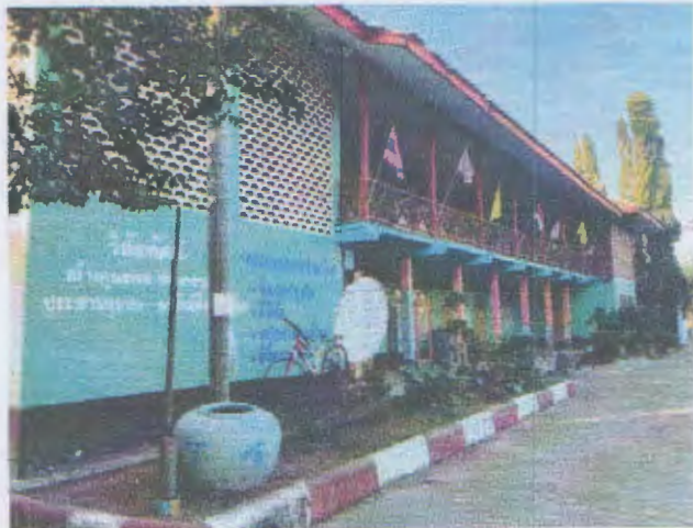
ด้านหน้าอาคาร